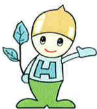
イメージキャラクター ドンぐり君

今、お使いの電気使用量と比べられてどうですか？太陽光発電システムを設置すると、これだけ1年間で発電いたします。